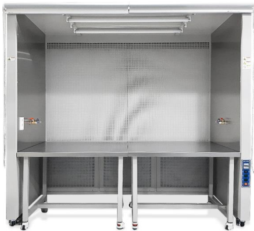
Horizontal non-vibration type clean bench DK-2000H