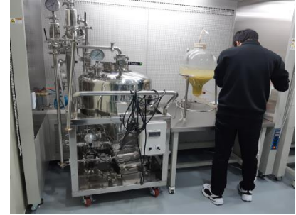
Bio reacting (Inoculation of a seed germ)