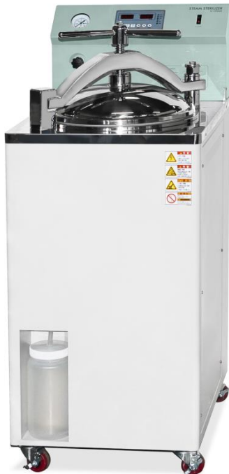
Auto Clave DK-AC45