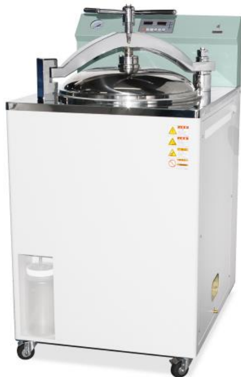
Auto Clave DK-AC100