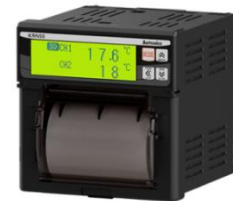
Compact recorder KRN50 (Option)