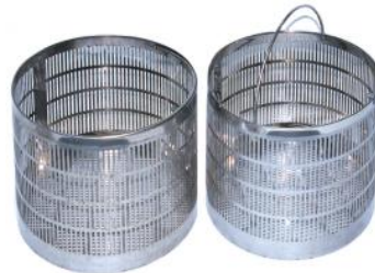
Stainless basket DK-ACSB60 (2 pcs)