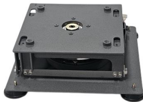
Shaker Mechanism DK-NTSK-SM