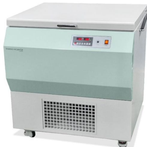
Shaking Incubator DK-SIF165