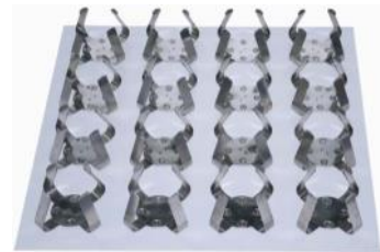
Flask holder with flask holder plate DK-SI-FH1000