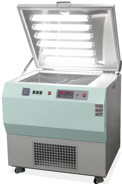
Shaking Incubator with Light source DK-SIF165